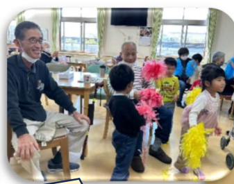
みんな一緒に、歌って、踊って、楽しいね!!